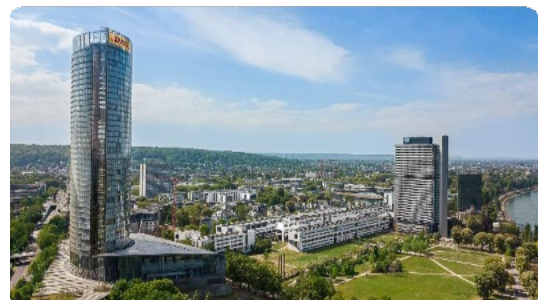
@BONNGLOBAL WORKSHOPS Making Cities Resilient 2030: 防災に