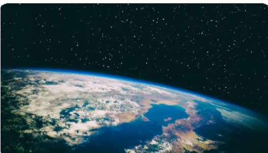
サイドイベント IPCC SUP FOR AR6