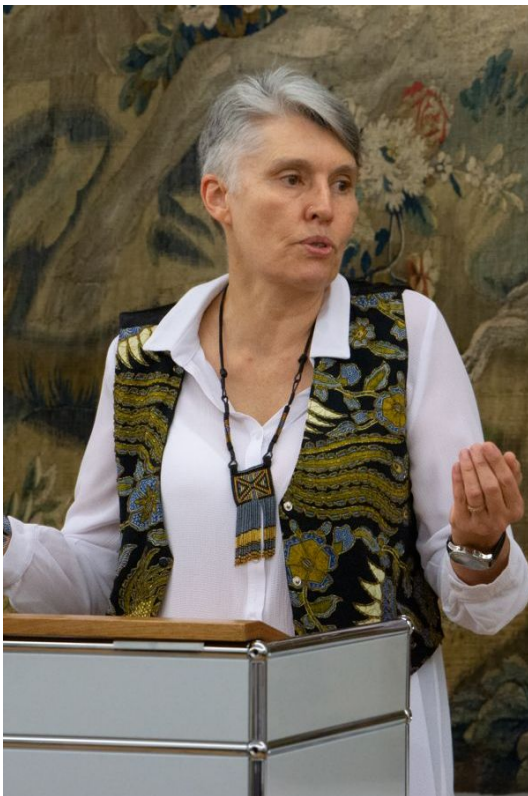
デブラ・ロバーツ博士はDaring Cities 2023で講演しました。ロバーツ博士は、IPCC の第2作業部会の共同議長です。