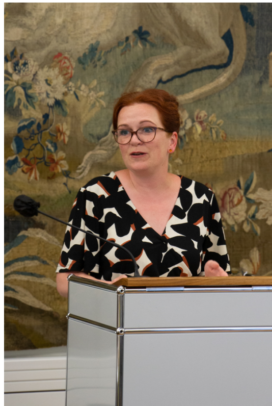
ドイツのボン市長のカーチャ・デルナーは、地元および地域のリーダーをDaring Cities 2023 に歓迎しました。

ご質問やサポートがございましたら、 daring.cities@iclei.org まで電子メールでお問