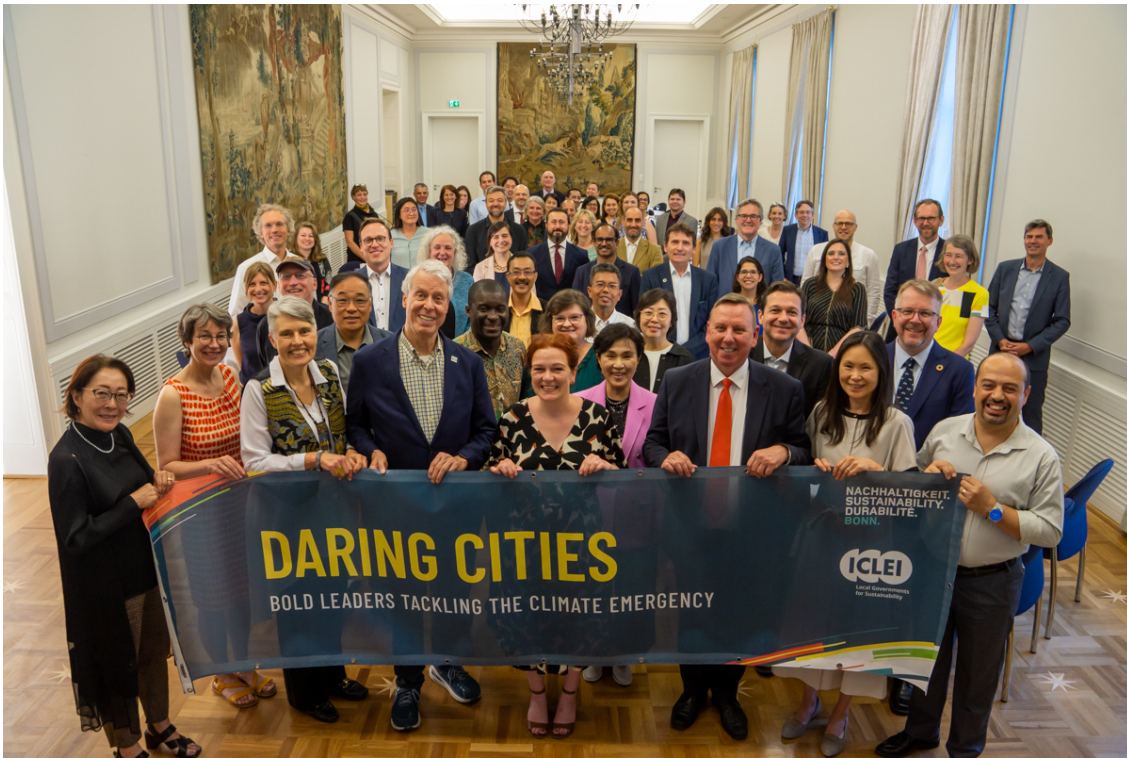
Daring Cities 2023 のリーダーたちは日曜日にボン市庁舎に集まります。