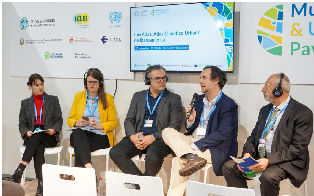
イベロ・アメリカ都市気候地図「IberAtlas」の立ち上げ