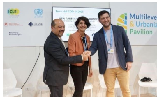
バクーからベレンまで：拡大された気候変動とイノベーションの課題の先駆的な都市。 アースデイ・グローバル・カンパセーションの開始。