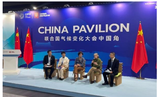
気候変動が土地と沿岸生態系に及ぼす影響：緩和と適応 ICLEIは、COP29 中国パビリオンで「自治体の日」を祝った。