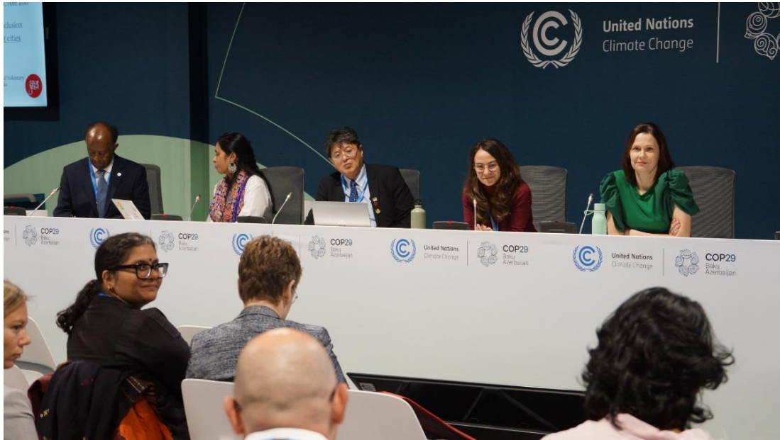
NDC3.0 に向けて NDC 3.0 に向けて：1.5C に沿った気候変動対策のためのマルチレベル・ガバナンスを解放するための UNFCCC サイドイベント。