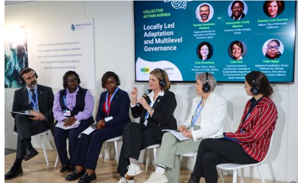
国連ハビタット副事務局長特別顧問兼 RISE UP プログラム・コーディネーターのセリン・キザックソットナム氏：都市脆弱性アトラスの立ち上げ」セッション。

イクレイは、「Water for Climate Pavilion パビリオン」において、水管理における地域主導のイニシアティブとマルチレベル・ガバナンスを探るセッションに参加した。